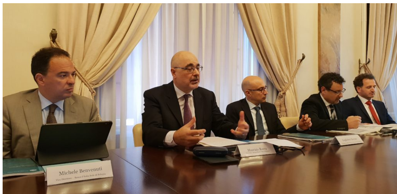
Presentazione stampa Rapporto Banca d'Italia