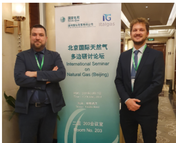
Evento in Cina

L'intento dichiarato della delegazione di Italgas e dei suoi principali fornitori è esportare le eccellenze italiane della distribuzione gas naturale attraverso l'accordo siglato con State Grid Corporation of China che prevede, tra l'altro, la condivisione di conoscenze, metodi e soluzioni applicati al settore energetico, in particolare nel settore della distribuzione del gas naturale.